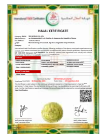
HALAL (IHC) 파키스탄