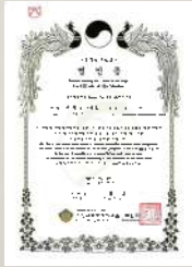
[한국무형문화유산 제KICAA23-0134호 부각명인]