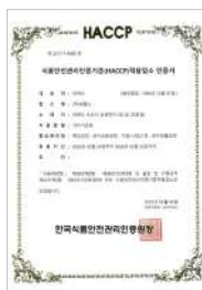
일반 HACCP (기타가공품, 과자류)