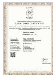
HALAL (HIPVT) 인도